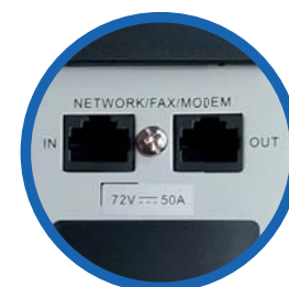
Supresor de picos Protección de línea de datos