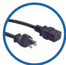
Conectores NEMA 5-15P / IEC-C19