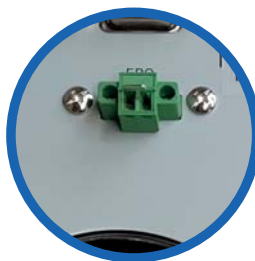
Puerto paro de emergencia