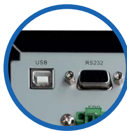
Puertos de comunicación

8 terminales de salida IEC - C13 de las cuales 4 terminales de salida son programables